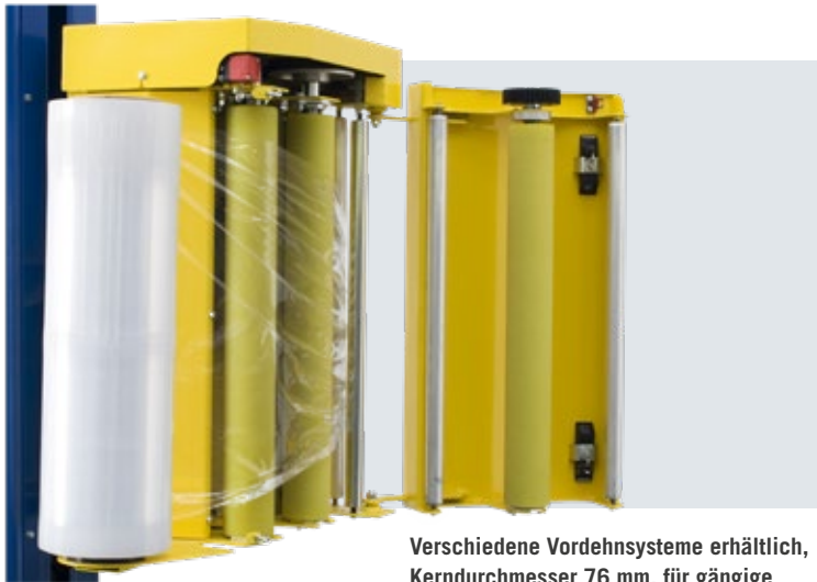
Verschiedene Vordehnsysteme erhältlich, Kerndurchmesser 76 mm, für gängige Maschinenstretchfolien