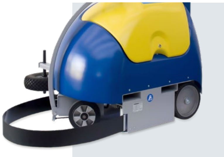
Rammschutz zur Vermeidung von Kollisionen und Beschädigung des Packstücks